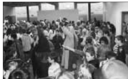
Nach der Übernahme feierten Hexen und Schüler gemeinsam