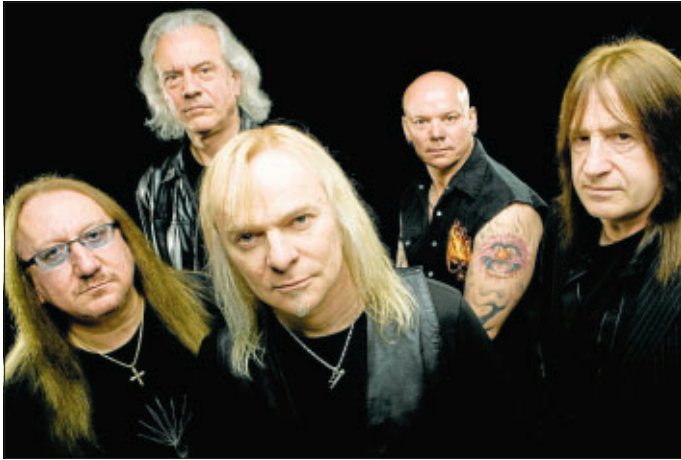
Sie kommt nach Ettlingen: die britische Hardrockband Uriah Heep.

In Kooperation mit der Stadt findet am 28. Mai ein "Rock Classics Festival" auf dem Gelände des van Broek Business & Eventparks, Nobelstr. 9 - 13 statt. Wie es sich bei einem Festival gehört, werden mehrere Bands an diesem Tag auf der Bühne stehen. Die Siegerband des Ettlinger Bandcontest 2011 wird das Festival eröffnen. Außerdem sind zu Gast: LoveTo Hate, Coverband aus dem Landkreis Karlsruhe mit