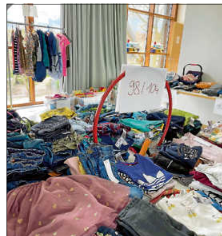
Vorschau auf den Flohmarkt

Bald ist es so weit – unser Flohmarkt im Kindergarten St. Elisabeth in Spessart steht bereits in den Startlöchern. Die Klamotten sind nach Größen von klein bis groß sortiert, die Spielsachen sind nach Altersgruppen geordnet und die Bar ist gefüllt.