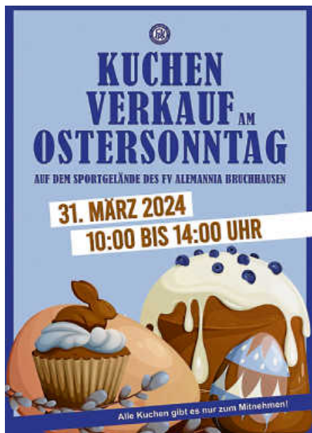
Plakat: FVA Bruchhausen

Kuchenverkauf beim FVA am Ostersonntag! Am Ostersonntag, 31. März, findet zwischen 10 und 14 Uhr auf dem Gelände des FV Alemannia wieder ein großer Kuchenverkauf zum Mitnehmen statt.