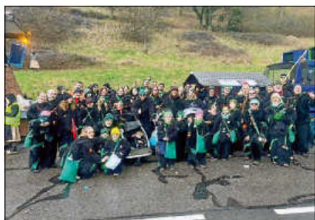
Moorteufel 2024