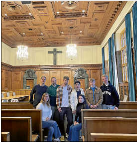
Hier wurde Geschichte geschrieben: Saal 600 des Nürnberger Justizpalastes

Geschichte wird an vielen Orten geschrieben – aber nur wenige haben so viel Einfluss gewonnen wie der Saal 600 des Nürnberger Justizgebäudes. Vor einem internationalen Militärgerichtshof mussten sich hier ab November 1945 führende Nationalsozialisten für ihre Verbrechen verantworten. Die Nürnberger Prozesse bereiteten damit den Weg für den heute bestehenden internationalen Strafgerichtshof in Den Haag. Eine Exkursion nach Nürnberg gehört damit für Geschichte-Leistungskurse quasi zum Pflichtprogramm.