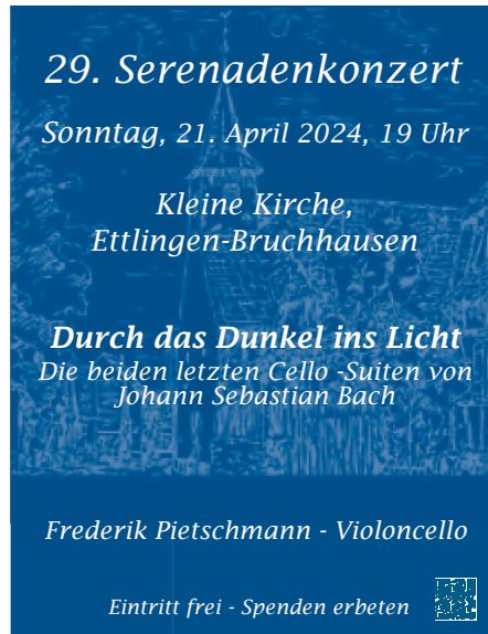
Plakat: Luthergemeinde Ettlingen