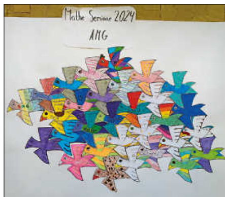
Parkettierung mit Vogelmotiv