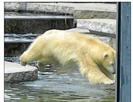
Neuzugang Nuka beim Sprung ins Wasser

Bei Nuka, der neuen Eisbärin, konnten wir miterleben, wie sie auf ihr Rufsignal reagierte und sich uns zeigte. Auf Eisbärenart probierten wir, wie weit wir springen können und sind „von Eisscholle zur Eisscholle“ gesprungen. Und siehe da, als würde sie es uns gleichtun, sprang auch die Eisbärin mit einem eleganten Sprung ins Wasser!