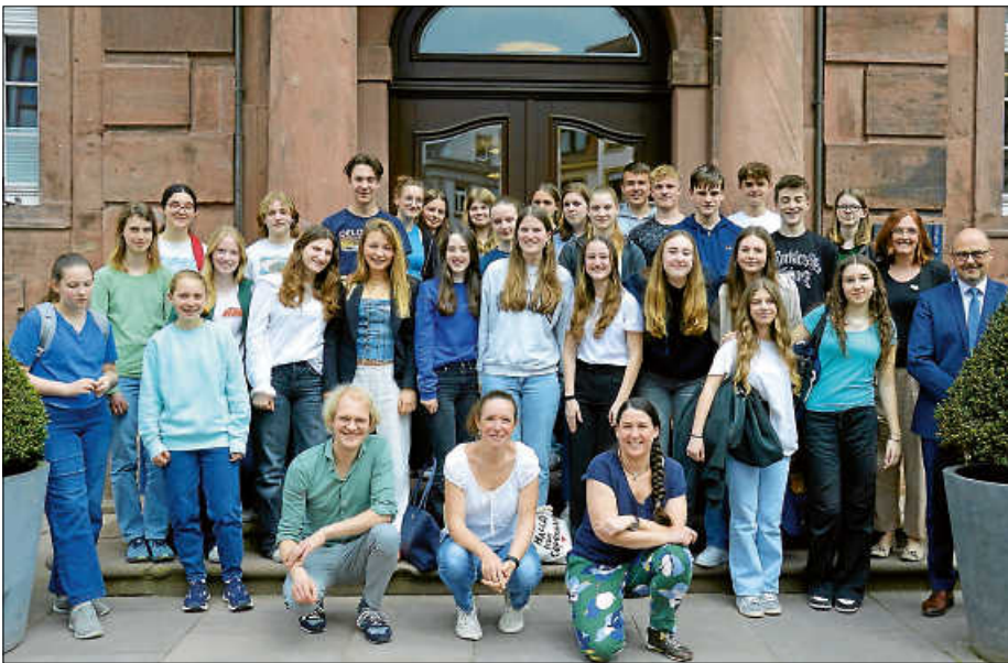
Schüleraustausch dank Erasmus+ zwischen dem Eichendorff-Gymnasium und einer Schule aus Utrecht.

Diese Beschreibung für Ettlingen kam sofort aus dem Mund einer jungen Utrechterin, die mit 14 weiteren Schülerinnen und Schülern zum Austausch nach Ettlingen kam. Erasmus+ hat die niederländischen Jugendlichen ans Eichendorff-Gymnasium geführt, bereits der zweite Austausch mit den Niederlanden,