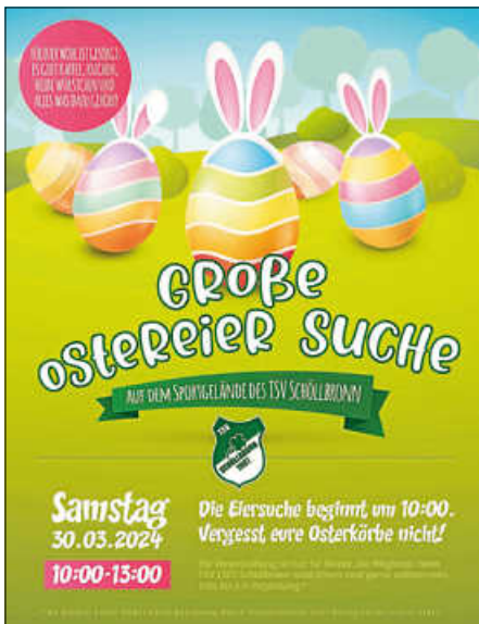
Plakat: TSV 1907 Schöllbronn e.V.

Gerne dürft ihr eure Eltern mitbringen. Kids bis 8 Jahre nur in Begleitung. Eine Betreuung durch den TSV Schöllbronn findet nicht statt.