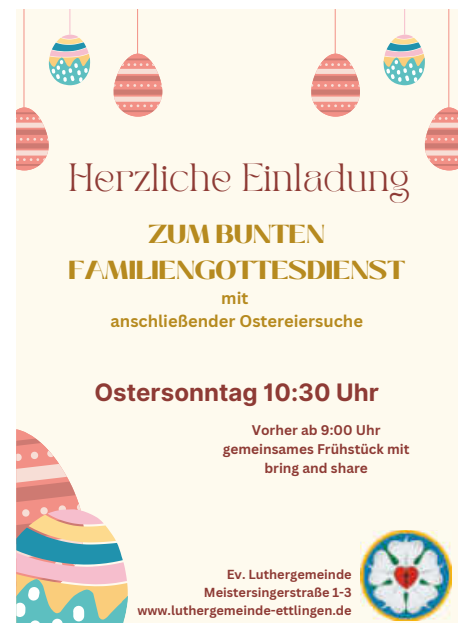
Plakat: D. Hilgers

Herzliche Einladung ab 9 Uhr zu einem Frühstück in Gemeinschaft. Brötchen, Butter und Getränke besorgen wir. Für den Rest zum Teilen, darf jede und jeder mitbringen, was er mag. Um 10:30 Uhr feiern wir dann einen bunten Familiengottesdienst mit einer anschließenden Ostereiersuche für alle Kinder rund um das Gemeindezentrum. Ganz herzliche Einladung dabei zu sein.