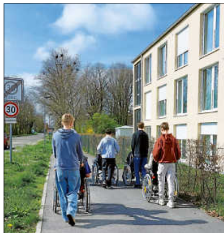
Ausfahrt mit Bewohnern im Rollstuhl

Tage eine sehr angenehme und aufgeschlossene Stimmung, bei Schülern wie Bewohnern.