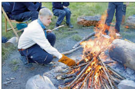
Ein wärmendes Feuer