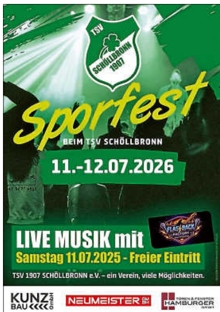
Plakat: TSV 1907 Schöllbronn e. V.

Liebe Freunde und Freundinnen des TSV, für unser Sportfest suchen wir Bedienungen, damit wir unsere Gäste bestmöglich bewirten können. Auch für andere Aufgaben suchen wir einige fleißige Helfer und Helferinnen. Wenn ihr Lust habt, an unseren Essens- und Getränkeständen oder im Service mitzuwirken und das Sportfest zu einem besonderen Erlebnis zu machen, meldet euch bitte bei unserem Vorstand unter a.baumgaertner@tsv-schoellbronn.de oder 0152 33512095. Vorab schon vielen Dank für euer Engagement!