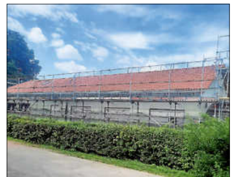
Neues Dach des Vereinsheims

Dem traditionellen Hähnchen-Haxenfest am 20. und 21. Juni steht nun nichts mehr im Wege. Der KTZV Bruchhausen lädt alle Interessierten herzlich ein, vorbeizukommen und uns durch den Festbesuch zu unterstützen.