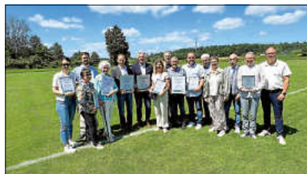
Geharte mit Vorstandsschaft

Am Dienstag dieser Woche traf die TSV-Elf im ersten Qualispiel auf den Zweiten der B3-Liga, den Bulacher SC. Das Ergebnis lag bei Redaktionsschluss noch nicht vor. Sollte die TSV-Elf es gewinnen, steht am Samstag, 13. Juni, 17 Uhr, das Finale um den A-Liga-Aufsteiger an. Das Spiel findet beim VSV Büchig statt. Alles Weitere auf der TSV-Homepage!