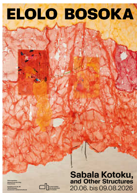
Plakat: Kunstverein Wilhelmshöhe e.V

Die Einzelausstellung des ghanaischen Künstlers Eलो Bosoka versammelt Malerei, Skulptur, Fotografie und Installation, die in den vergangenen vier Jahren an verschiedenen Orten in Europa entstanden sind. An der Schnittstelle von Found Objects und Malerei entstehen Arbeiten, die seine täglichen Wege und persönlichen Begegnungen mit Objekten, Strukturen und Farben wiedergeben, „Painterly Objects“ nennt er diese Bildformen. Auch die Zwiebelsäcke, Sabala Kotoku auf Evegbe , sind ein solches Material: ein typisches Warenbehältnis aus Ghana, das in Bosokas Skulpturen zur Oberfläche und Form wird. Eलो Bosoka *1991 lebt und arbeitet zwischen Tefle, Accra und Kumasi. Er studierte an der Kwame Nkrumah University of Science and Technology (KNUST) in Kumasi, Ghana (BFA 2015, MFA 2019), wo er derzeit promoviert. 2022 erhielt er das Baden-Württemberg-Stipendium und studierte an der Staatlichen Akademie der Bildenden Künste Karlsruhe.