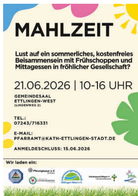
Plakat: Marcel Derer

Am 21. Juni wird im Gemeindesaal Ettligen-West ein Frühschoppen und Mittagessen vom Grill angeboten. Anschließend gibt es auch Kaffee und Kuchen. Der Kleingartenverein freut sich, diesen Tag gemeinsam mit der Schreiberjugend, dem Pfennigbasar, der Pfarrei St. Martin Ettligen, der Interessengemeinschaft Ettligen-West und der Luthergemeinde zu organisieren.