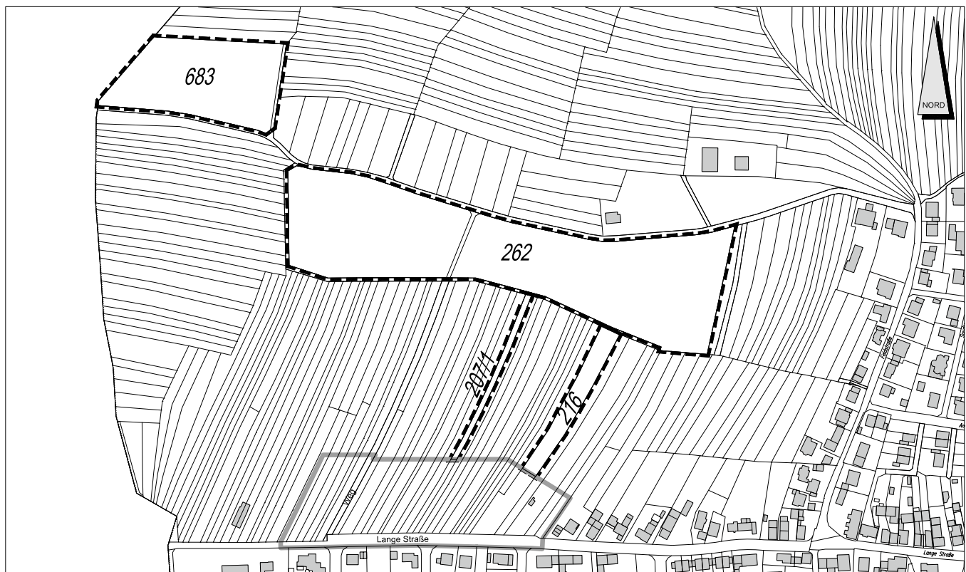
Bebauungsplan "Lange Straße Nord", Schluttenbach Übersichtsplan II CEF-Maßnahmen und sonstige Maßnahmen außerhalb des Geltungsbereichs