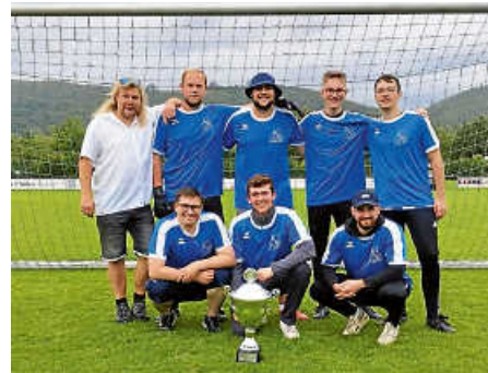
Unser Team bei dem Elfmeterschießen der örtlichen Vereine

(Kleiner Funfact, unser Altersdurchschnitt liegt auch weit unter dem der Stadt Ettlingen) Da viele unserer Musiker Studenten oder Schüler sind, und auch teilweise nicht mehr hier wohnen, da sie zum Studieren in eine andere Stadt gezogen sind, ist unsere Auftritts- und Probeplanung sehr flexibel. Jeder Auftritt und jedes Event werden gemeinsam beraten, so dass für alle ein geeigneter Termin gefunden werden kann. Besonders unser Jahreskonzert ist auf Grund seines abwechslungsreichen Programms von Kooperationen mit Chören, anderen Blasorchestern bis zu Rockbands jedes Jahr ein Highlight.