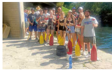
Ein Teil unserer Jugend beim Kanufahren

Herzlich willkommen beim Musikverein Ettlingenweiler!