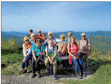
Wandergruppe 2023

Am 08.10.2023 fand unsere Herbstwanderung bei sommerlichen Temperaturen und blauem Himmel statt. Eine kleine Schar Wanderlustiger startete am Dobel und kehrte nach ca. 15 km in Bad Herrenalb zum Abschlussessen ein. Es war wieder ein rundum gelungener Tag. Danke an Rita und Harald Gilcher für die Organisation.