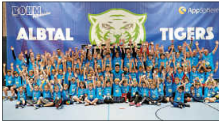
Über 80 Kids waren beim Handballcamp dabei!

des Camps bereits erreicht (80 Kids) und die Nachrückerliste musste eröffnet werden. Aufgrund dieses großen Ansturms kam es gar nicht mehr zu einer Bewerbung des Camps auf der Webseite bzw. den sozialen Medien.