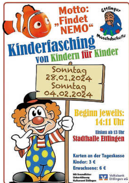
Plakat: Werbung und mehr

An beiden Kinderfaschings findet wieder ein Kostümwettbewerb in Zusammenarbeit mit der Volksbank Ettlingen statt. Mit von der Partie sind befreundete Vereine und die Narrenvereinigung Ettlingen.