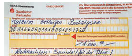
Spende an das Tierheim

Richtig viel Freude brachte auch die Idee, Wünsche am Tor des Tierheims aufzuhängen. Die Zettel wurden mitgenommen, die darauf genannten Dinge gekauft und mitsamt dem Zettel als „Nachweis“ im Tierheim abgegeben.