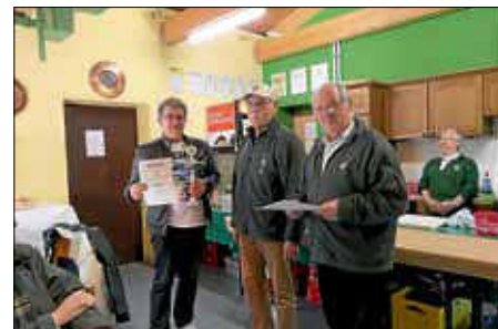
Siegerehrung 7. Freundschaftsschießen Hist. Bürgerwehr Karlsruhe

So. 24.11. Totenehrung am Rathausehrenmal 11.00 Uhr.