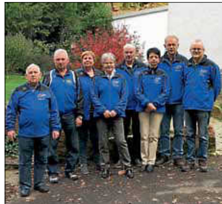
Starter der DM LG-Auflage

Die Platzierung der beiden Schützen stand bei Redaktionsschluss noch nicht fest.