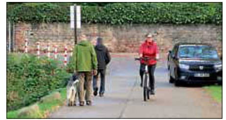
Die Begleithunde im Verkehrsteil

Allen Startern nochmals herzlichen Glückwunsch und weiterhin viel Spaß und Erfolg mit den Vierbeinern.