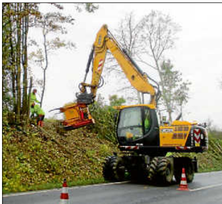
Gehölzarbeiten entlang der Straßen im Landkreis haben begonnen.

Ist der Grünstreifen neben einer Straße nur schmal, werden die Gehölze regelmäßig „geläutert“. Dabei werden einzelne Gehölze entfernt, damit die Verbleibenden neue Triebe ausbilden können. Junger Bestand wird ebenfalls durch gezieltes Läutern gepflegt, älterer Bestand wird abschnittsweise auf zehn bis 20 Zentimeter zurückgeschnitten. Jedes Jahr steht dabei ein anderer Abschnitt auf dem Programm. Ökologisch besonders wertvolle Gehölze bleiben jedoch, wenn keine Gefahr von ihnen ausgeht, bestehen.