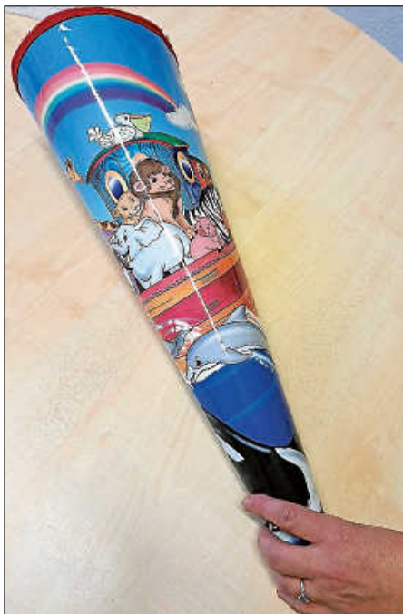
Schultüte für die Schulanfänger 2025

An diesem Abend stellen wir Ihnen vor, was Schulfähigkeit heißt und wie Sie Ihr Kind auf dem Weg zur Einschulung begleiten können. Die Kooperationslehrerinnen stellen ihre Arbeit vor.