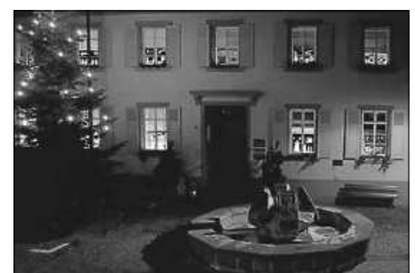
Rathaus im Advent