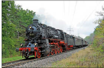
Die 58 311 (eine bad G12, gebaut 1921 in Karlsruhe) und die Eilzugwagen aus den dreißiger Jahren, hier bei Rastatt-Wintersdorf.

Der Dampfbzug hält außer in den genannten Bahnhöfen auch in Rastatt, Kuppenheim, Gaggenau, Gernsbach, Weisenbach, Langenbrand, Forbach, Schönmünzsch zum ein- und aussteigen. Für Speis und Trank fährt der ebenfalls historische Speisewagen mit, und ein Gepäckwagen für kostenlosen Fahrradtransport.