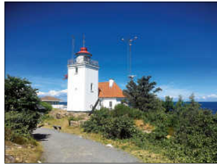
Leuchtturm am Küstenweg

Vortrag „Bornholm“ – Spannende Küstenpfade auf der dänischen Ostseeinsel.