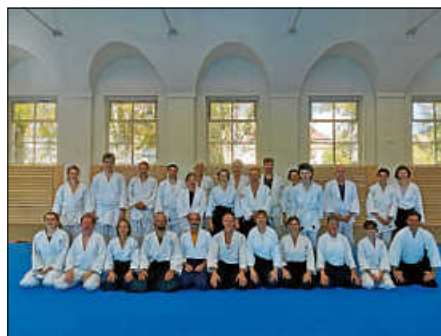
Teilnehmer des Lehrgang

Wir freuen uns schon auf das Aikido-Seminar mit Renata im nächsten Jahr!