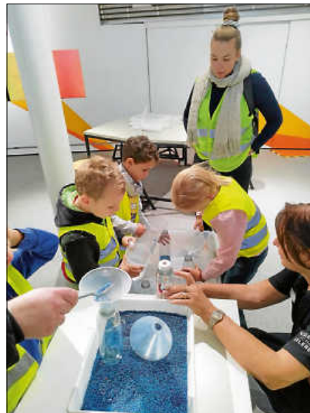
Die Kinder stellen einen Flaschentaucher her