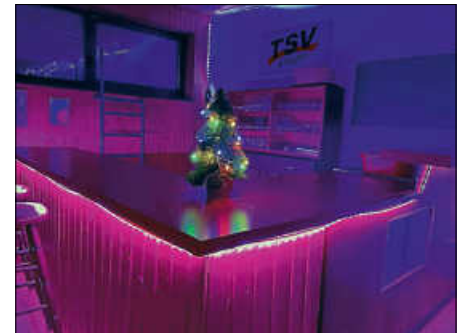
Der weihnachtlich geschmückte Vereinsraum des TSV.

Der TSV Ettlingen blickt dankbar auf ein bewegtes Jahr zurück – gekrönt von 115 Neumitgliedern, zahlreichen Projekten und dem starken Einsatz seiner Ehrenamtlichen. Ein großes Dankeschön gilt allen, die dazu beigetragen haben. Gemeinsam freuen wir uns auf ein sportliches und erfolgreiches Jahr 2026! Wir wünschen allen Mitgliedern, Freundinnen und Freunden sowie Unterstützenden einen entspannten Jahresausklang und einen tollen Start ins neue Jahr.