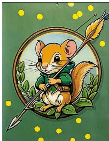
Elli unser Maskottchen

Wir gratulieren allen Teilnehmern zu ihren Ergebnissen und freuen uns auf die nächsten Wettkämpfe (Landesmeisterschaften) Ende Januar.