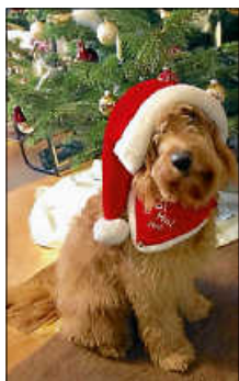
Wir wünschen allen ein fröhliches Weihnachtstfest und ein gutes neues Jahr Weihnachtsgrüße 2026