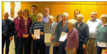
Gruppenbild aller Jubilare

Nach dem offiziellen Programm wurde noch ein gemeinsames Mittagessen eingenommen.