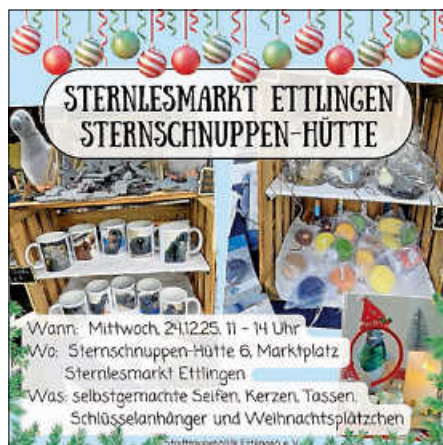
Flyer: Stadttaubenhilfe Ettlingen e.V.

Ihr findet uns in der Sternschnuppen-Hütte 6 auf dem Marktplatz , direkt vor dem Rathaus. Kommt gern vorbei!