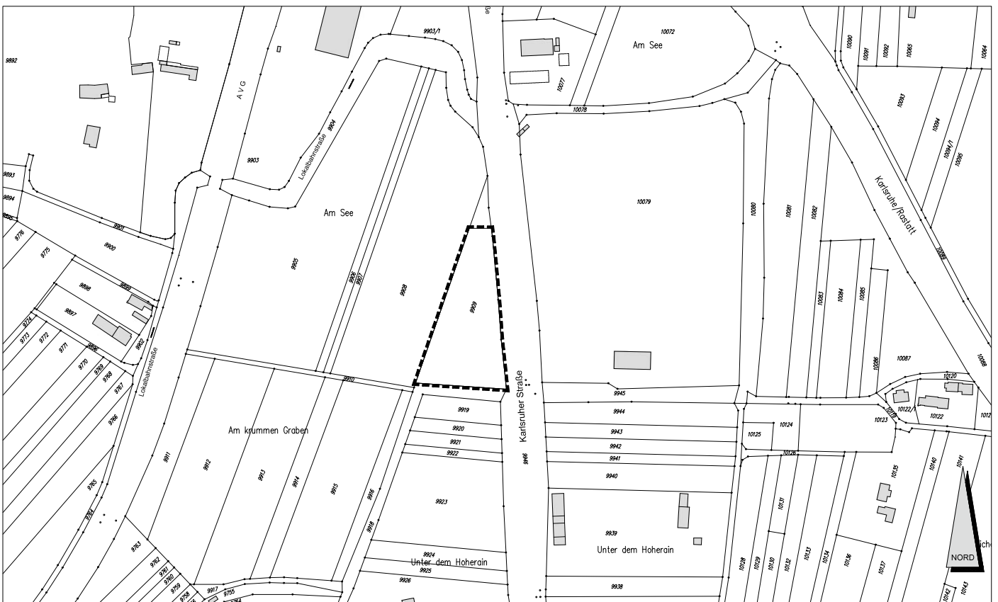
Bebauungsplan "Schleifweg-Kaserne Nord - Teilbereich Gewerbe + Wohnen West"