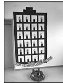
gebastelte Kerzen der Kinder