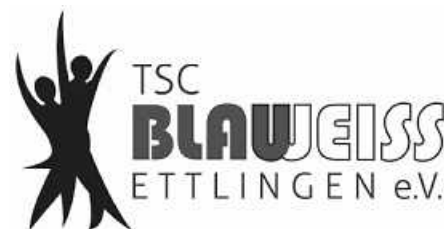
Logo: TSC Blau-Weiß

Angelehnt an die bundesweite Aktion des Deutschen Tanzsportverbandes unter dem Titel „#DontStopDancing“, haben engagierte Paare und Vorstände des TSC Blau-Weiß tolle Videosequenzen für kleine Trainingseinheiten zuhause erstellt. Bereits während des ersten Lockdowns wurden die Mitglieder zur erfindungsreichen „Tanznavigation“ in Wohnzimmer und Garten animiert. Schon zu diesem Zeitpunkt konnten Videomitschnitte aus den Trainingsgruppen zur Verfügung gestellt werden.