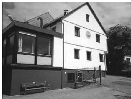
Naturfreundehaus Gaistal

Das Jahresprogramm wird in den nächsten Wochen ebenfalls an die Mitglieder versendet und liegt dann auch in der Stadthalle aus.