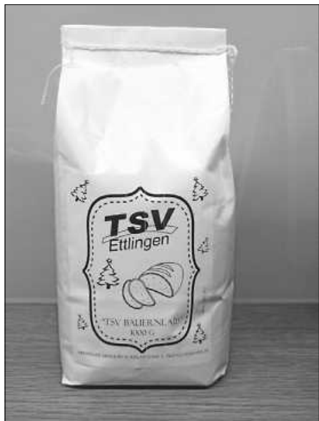
Das „TSV Bauernlaib“

Aber auch der TSV hat Wünsche: Wir wünschen uns für 2021, sobald der Sport wieder losgehen kann, wieder eine rege Trainingsbeteiligung von allen kleinen und großen, sowie jungen und junggebliebenen Sportlerinnen und Sportler!