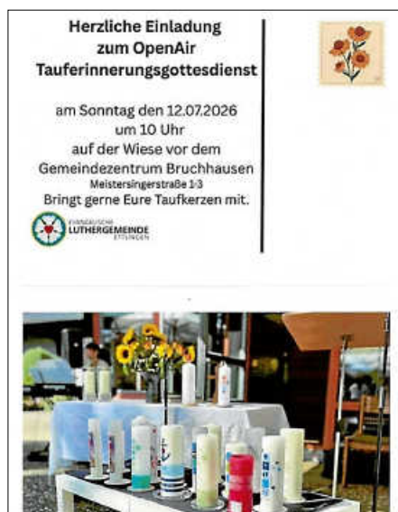
Plakat: Luthergemeinde Ettlingen