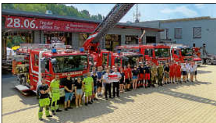
Spende über 500 Euro an Paulinchen e. V.

Ein besonderes Zeichen der Wertschätzung und des sozialen Engagements setzte die Feuerwehr gemeinsam mit ihren Ausstellern. Anstelle der sonst üblichen Gastgeschenke für die teilnehmenden Aussteller wurde der Geldbetrag gesammelt und an Paulinchen e. V., die Initiative für brandverletzte Kinder, gespendet. Im Rahmen der Veranstaltung konnte ein Spendencheck an den Verein überreicht werden. Damit unterstrichen alle Beteiligten ihre Wertschätzung des guten Zwecks, der in besonderer Weise mit den Aufgaben der Feuerwehr verbunden ist.