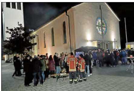
Winterzauber 2023