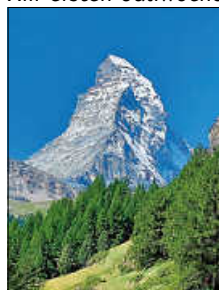
traumhafter Blick auf das Matterhorn beim 20. Jubiläum

Am ersten Juliwochenende war der LT Ettlingen auch beim Jubiläumslauf des 20. Gornergrad Zermatt Marathons erfolgreich vertreten. Bei schönstem Wetter und strahlenden Sonnenschein konnten die Läuferinnen und Läufer das atemberaubende Bergpanorama in vollen Zügen genießen. Der schönste Berg der