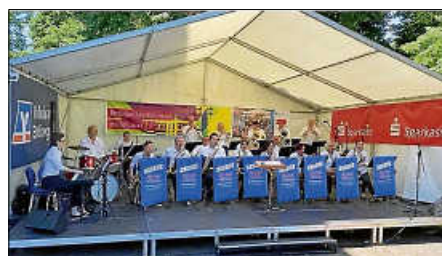
Musikfestival 2022

Nach der offiziellen Eröffnung des Musikfestivals Ettlingen um 11.30 Uhr auf der Bühne am Marktplatz startete das Programm auf sieben Bühnen mit fast 50 Chören und Orchestern um 12 Uhr. Wir können auf einen gelungenen Auftritt bei hochsommerlichen Temperaturen auf dem Hugo-Rimmelspacher-Platz zurückblicken, unsere Big Band machte den Auftakt dort von 12.00 Uhr bis 12.45 Uhr.