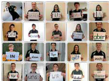
Kreative TTV-Jugend!

Eine schöne Aktion unserer Jugend - so bleibt die Kommunikation und die Kreativität erhalten. Frohe Ostern!