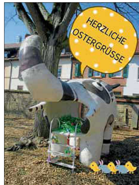
Unser Elefant

Viel Spaß dabei - wir freuen uns schon auf Dich!