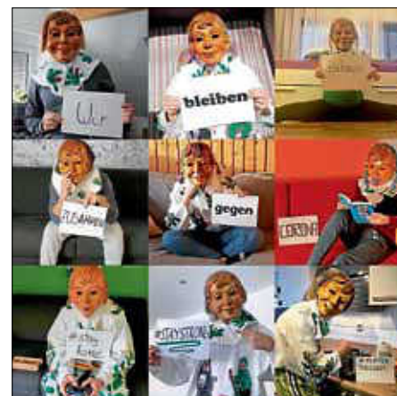
Die Dohlenaze bleiben Zuhause