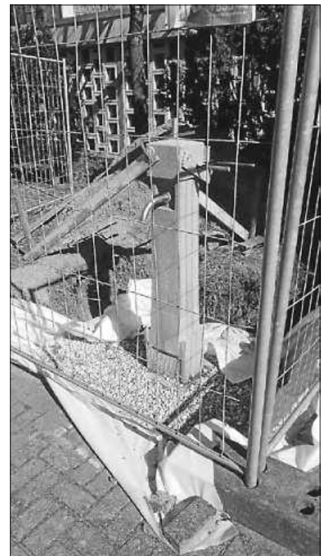
Zukünftige frostsichere Wasserstelle auf dem Friedhof

Aufgrund der aktuellen Situation bleibt die ortsgeschichtliche Ausstellung in der Ortsverwaltung Bruchhausen am Sonntag, 5. April, geschlossen.