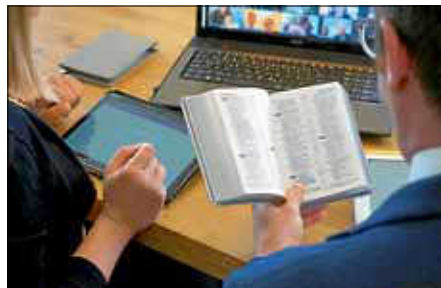
Online-Gottesdienst in Zeiten von Covid-19

Kontaktadresse: Jehovas Zeugen Ettlingen, Ralf Esser, Im Ferning 45.