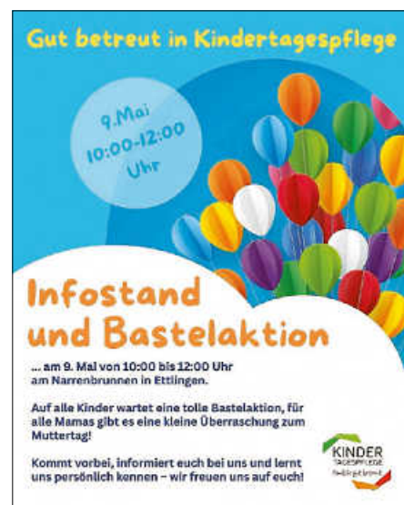
Plakat: TEV Ettlingen