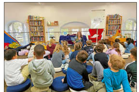
Buchcasting in der Stadtbibliothek