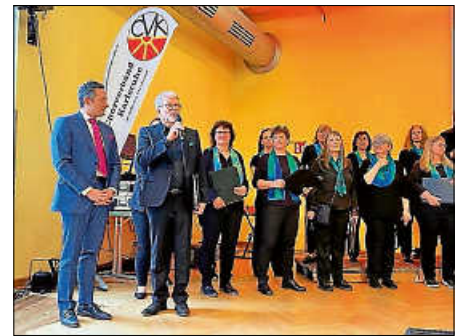
Chorverband Karlsruhe feiert 100-Jähriges

soll sie 2026 eine noch stärkere Lobby erhalten. Horst Winter bat dabei alle Chöre um engagierte Unterstützung.