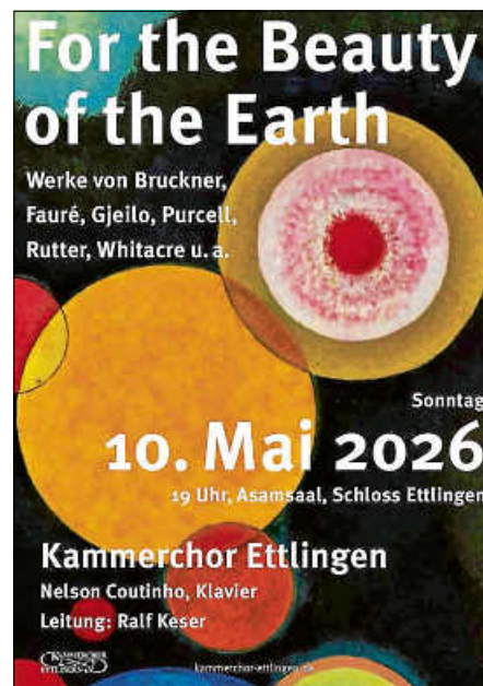
Flyer „For the Beauty of the Earth“