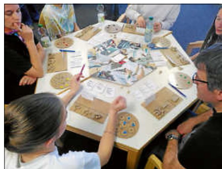
Spiele zum Thema Nachhaltigkeit