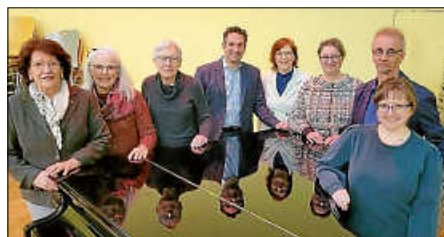
Vorstand der Liedertafel Ettlingen

Mit großem Engagement, neuen Ideen und einer starken Gemeinschaft blickt die Liedertafel zuversichtlich auf die kommenden Monate und freut sich auf ein weiteres klingvolles Jahr.