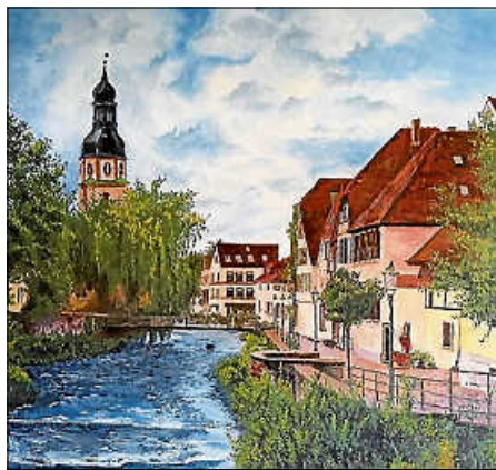
Andreas Neumeier