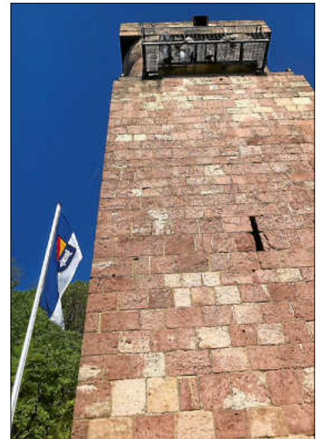
Bismarckturm ist wieder für „Weitblick“ geöffnet