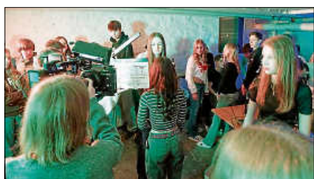
Auch die 9e wirkte beim Film mit. Hier als Gäste einer Party, gedreht im Keller der Schule.