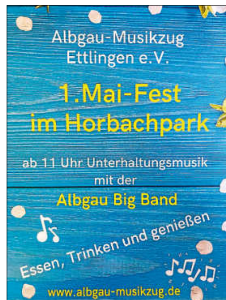
Plakat: Albgau Big Band

Musikalisch spielen für Sie unsere Bands, die Albgau Big Band sowie Hardcover. Bei schlechtem Wetter wird das Fest kurzfristig abgesagt.