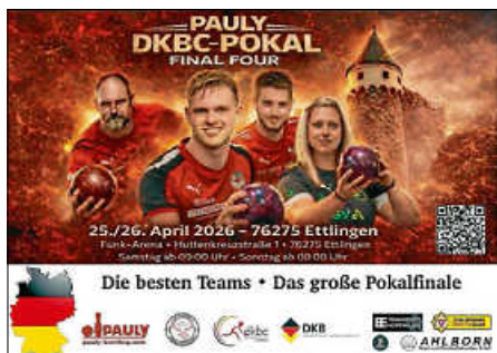
Plakat: Ettliger KV