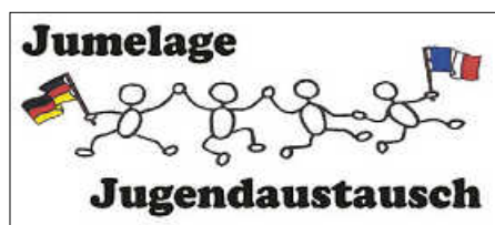
Grafik: J. Heinzler

Der Jugendaustausch findet vom 1. bis zum 8.8. in Frankreich statt. Wir werden mit den Jugendlichen nach Étoges, Fèrebrianges und Beunay fahren.