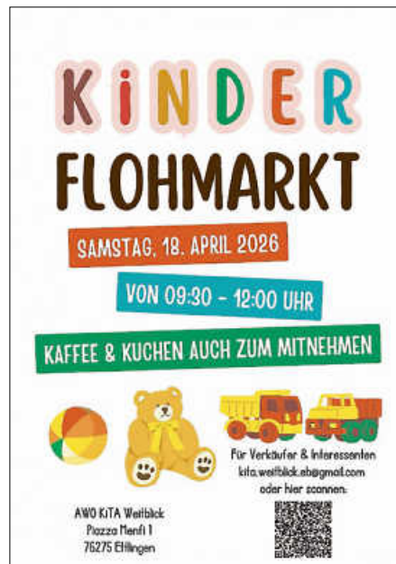
Plakat: KiTa Weitblick Elternbeirat

Die Standgebühr beläuft sich auf 15 Euro oder 10 Euro mit Kuchenspende.