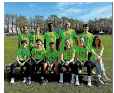
SSV-Jugend-Leichtathleten im Trainingslager

Im Hotel wurden alle nach dem Training mit gutem Essen versorgt, und der Wellnessbereich konnte zur Regeneration genutzt werden. Auch außerhalb des Trainings fanden in der Woche abwechslungsreiche Aktivitäten zur Stärkung des Teamgeistes statt.