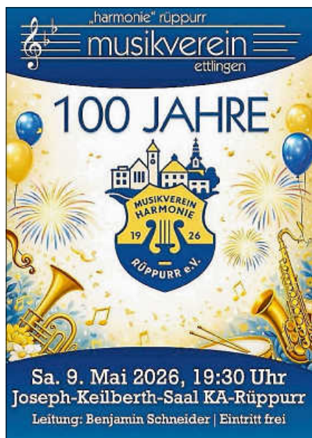
Plakat: Achim Jakob

Am Samstag, 9.5. findet um 19:30 Uhr das Jahreskonzert des mit uns in Spielgemeinschaft musizierenden Musikvereins „Harmonie Rüppurr“ statt. Entsprechend treten auch wir im Joseph-Keilberth-Saal des Wohnstifts Karlsruhe in Rüppurr auf. Wir möchten alle hierzu einladen. Passend zum 100-jährigen Bestehen führt unser Programm durch die Musik der vergangenen 100 Jahre. Man kann auf jeden Fall gespannt sein.