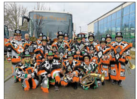
Umzug in Kirrlach

Es geht wieder los! Ab 28. April starten wieder unsere Proben für die neue Kampagne jeweils dienstags ab 19 Uhr im Jugendzentrum Specht.