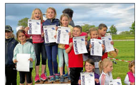
Die siegreiche U8-Mannschaft...