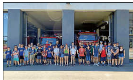
Besichtigung der Landesfeuerwehrschule

Am Donnerstag stand der erste große Programmpunkt auf dem Plan: die Stadt-Rallye durch Bruchsal . An mehreren Stationen mussten Aufgaben gelöst und möglichst viele Punkte gesammelt werden. Ganz schön viele Kilometer wurden da zurückgelegt. Zum Glück gab es unterwegs ein Eis und Abkühlung beim Schwamm-Geschicklichkeitswerfen. Statt Entspannung auf dem Zeltplatz am Nachmittag musste jedoch erst einmal das gesamte Lager aufgrund des herannahenden Gewitters in die angrenzende Sporthalle evakuiert werden. Das hatte nicht nur ein bisschen Nervenkitzel (für die Jüngeren) zur Folge, auch das Abendessen verspätete sich entsprechend. Die Anstrengung des Tages war allen deutlich anzumerken.