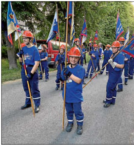
Wimpelträger führen den Fackelumzug an

Bruchsaler Wehr, die durch das Gerätehaus geführt haben. Hier konnte auch die eine oder andere Inspiration für das neue Gerätehaus Ettligen Berg aufgeschnappt werden. Besonders beeindruckt hat sicherlich der Jugendraum mit u.a. Tischkicker, Billard, Air-Hockey-Tisch und Chill-Out-Ecke. Zurück im Zeltlager angekommen – sichtlich kaputt und von der Hitze platt – konnte die Stimmung mit einer kleinen Überraschung aufgebessert werden: Unsere Kameraden aus Ettligen hatten inzwischen mit dem Wechsellader das Wasser für zwei Löschwasserpools herangeschafft. Eine kleine Auswahl an Spritzpistolen tat ihr Übriges: Eine ausgiebige Wasserschlacht konnte nicht mehr verhindert werden.