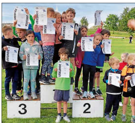
... und die strahlende U10-Mannschaft

Am Ende feuerten die Kinder auch noch ihren Trainer Felix Nübel an, der nach der erfolgreichen Betreuung seiner Mannschaften noch selbst über die 100 m der Jugend U20 an den Start ging und diese mit der Zeit von 11,70 s gewinnen konnte. Ein rundum erfolgreicher Wettkampf für die ganze Gruppe und ein wunderschönes Mannschaftserlebnis!