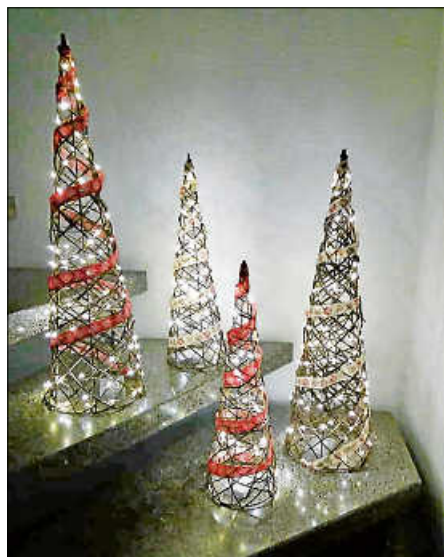
Weihnachten wirft seine Lichter voraus

Wie es schon Tradition ist, besteht auch die Möglichkeit zur Adventszeit passende Deko-Artikel zu erwerben. Vielleicht suchen Sie noch das eine oder andere Geschenk?