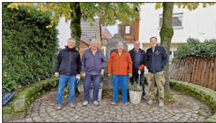
Reinigung des Kriegerdenkmals am Dorfplatz in Oberweier.

Im November widmet sich die Kameradschaft ehemaliger Soldaten schon seit vielen Jahren der Pflege des ortseigenen Kriegerdenkmals am Dorfplatz und der Pflege des Gedenksteines am Waldsaumweg.