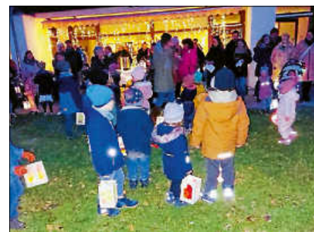
Sankt Martinsfest im Kindergarten

Am 14. November war es endlich soweit – das von den Kindergartenkindern sehnsüchtig erwartete Laternenfest stand auf dem Plan. Aber leider meinte es das Wetter an diesem Tag nicht so gut mit uns, weswegen die Feierlichkeiten etwas kleiner als gewohnt stattfanden. Auf den Laternenumzug mit gemeinsamem Gesang durch Spessart musste in diesem Jahr verzichtet werden.