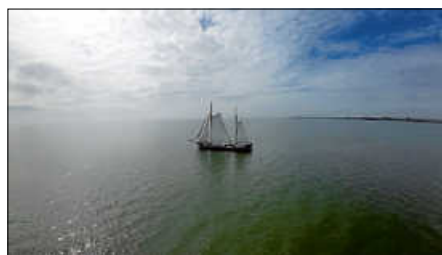
Unser Zweimaster Allure