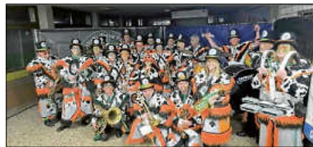
Hallenauftritt in Plittersdorf

Denn aktuell suchen wir noch Aktive, egal ob Single oder Paare, mit oder ohne Kinder, ob Laie oder vorgebildet, bei uns sind alle willkommen. Schnupperinstrumente sind vorhanden und können bei Interesse oder Bedarf auch besorgt werden. Bei Interesse: Fon: 01733533718, www.chaos-moggel.de