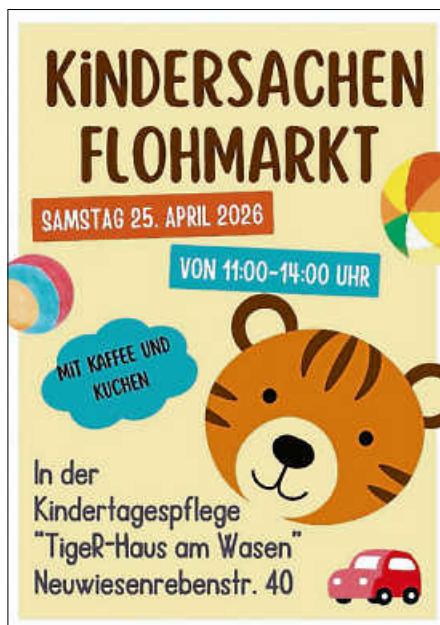
Plakat: TEV Ettlingen