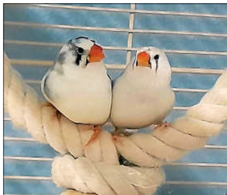
Zebra & Fiink

Möchten Sie die beiden einmal kennenlernen? Bitte schreiben Sie uns eine aussagekräftige E-Mail an: info@tierheim-ettlingen.info