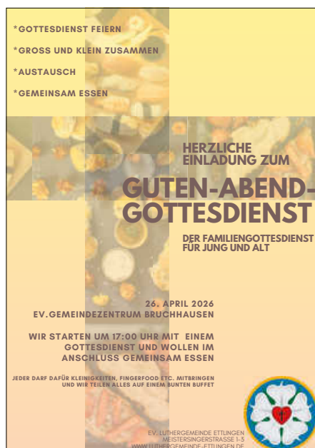
Plakat: D. Hilgers

Am Sonntag, 26.4. findet um 17 Uhr der nächste „Guten-Abend-Gottesdienst“ im Gemeindezentrum in Bruchhausen statt. Alle sind eingeladen, den bunten Gottesdienst mitzufeiern, in dem verschiedene Generationen sich begegnen können. Im Anschluss wollen wir wieder miteinander essen und eine tolle Gemeinschaft haben. Wenn alle eine Kleinigkeit wie Fingerfood etc. mitbringen, können wir auf einem bunten Buffet viele leckere Sachen teilen.