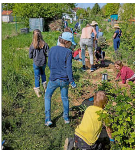
Kinder aktiv im Vereinsgarten