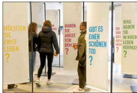
Die Schülerinnen und Schüler in der Ausstellung.

Der Besuch regte zum Nachdenken an – über das Leben, über das Sterben und über das, was uns wirklich wichtig ist. Wir danken dem Hospizförderverein für das Engagement.