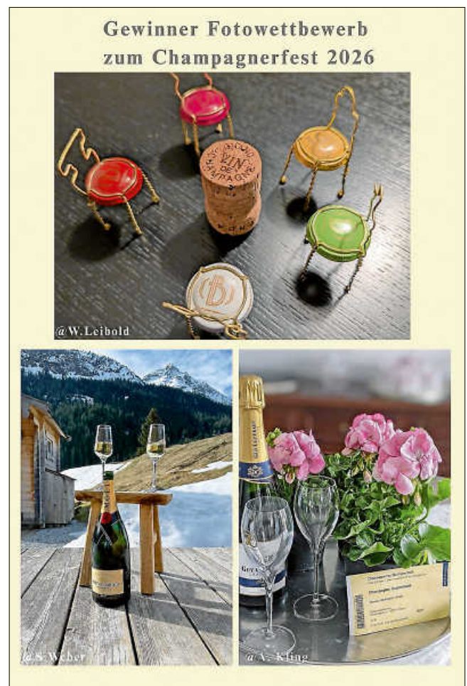
Die Gewinner des Fotowettbewerbs

Unglaublich viele schöne und kreative Fotos haben wir auf unseren Fotowettbewerb zum 10. Champagnerfest erhalten“, so Nina Grießhaber. Gemeinsam mit ihrer Kollegin Ilka Schmitt haben sie die besten Drei ausgewählt. Den Fotografen winkt ein prickelnder Genuss. „Allen Teilnehmern danken wir für ihre ‘Schnappschüsse’.