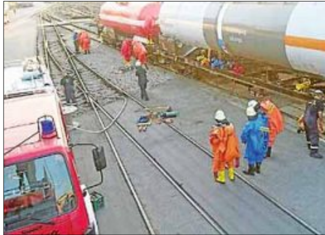
Der Gefahrstoff-Übungszug des Landkreises machte zu Übungszwecken Station am Hauptbahnhof Karlsruhe.

Im Landkreis Karlsruhe sind zwei Gefahrgutzüge (Nord und Süd) stationiert. Der Gefahrgutzug Landkreis Karlsruhe Süd ist bei Gefahrgutunfällen für den gesamten südlichen Landkreis Karlsruhe zuständig. Er setzt sich aus mehreren Feuerwehren zusammen: Feuerwehr Ettlingen (Abteilungen Bruchhausen und Ettlingen Stadt) sowie Rheinstetten (Abteilungen Rheinstetten und Neuburgweiler) und Malsch (Abteilungen Malsch, Sulzbach, Völkersbach und Waldprechtsweyer). Der Gefahrgutzug hatte die seltene Chance, am 17. August unter realen Bedingungen an einem Kesselwagen der deutschen Bahn eine Einsatzübung durchzuführen. Der Übungszug machte Station in Karlsruhe am Hauptbahnhof.