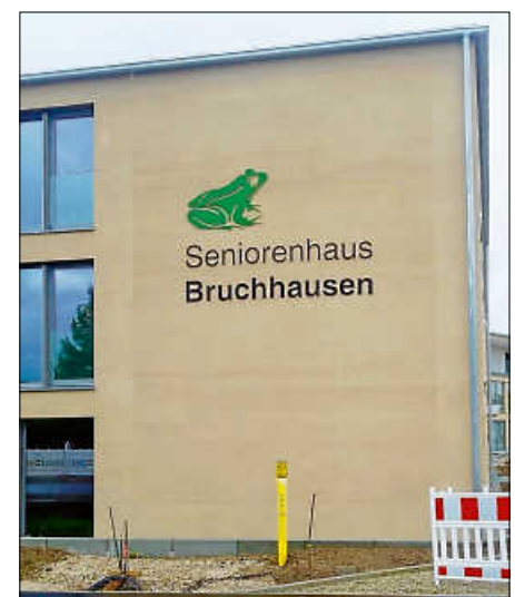
Die Frosch-Familie hat Zuwachs bekommen