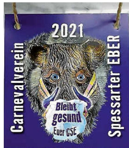
Unser Spar-Jahresorden 2021

on kreiert, den wir dann mit angehängtem Schoko-Küsschen kontaktlos an der Haustür an alle unsere Aktiven und Sponsoren verliehen haben. Für unsere Jugend gab's noch ein Clownsnäschen dazu. Die Aktion ist super angekommen und so wird uns unser „Spar-Corona-Orden“ immer an diese Zeit erinnern.