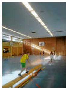
Basketball Stufe 4

Der TSV Ettlingen war letzte Woche zu Gast bei Stufe 4 und hat mit den Kindern ein Basketballtraining durchgeführt. Die Kinder kennen zwar bereits den Umgang mit dem Ball, doch das Basketballspielen war bei einigen eine Premiere. Vielen Dank an den TSV Ettlingen für die schöne Schnupperstunde!