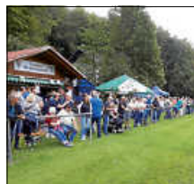
Fachkundiges Publikum beim Trainingscamp der Nationalmannschaft

Bei den hervorragenden Rasen- und Platzbedingungen sowie der guten Organisation durch die Faustballabteilung des TV Schlüttenbach hatten die Nationalspielerinnen die besten Voraussetzungen.