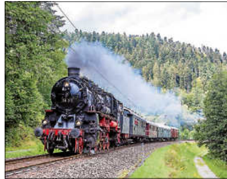
Die über hundertjährige badische G12 und ihre Wagen, die auch schon ü80 sind.

Jetzt am Sonntag fährt wieder der Zug der Dampfnostalgie Karlsruhe mit der Dampflokomotive 58 311 entlang der Alb, wo sonst nur moderne Straßenbahnwagen fahren, nach Bad Herrenalb. Der Zug besteht aus Eilzugwagen aus den 30er Jahren, einem passenden Speisewagen, wo Sie sich stärken können, und einem Gepäckwagen, der Fahrräder gerne kostenlos befördert.