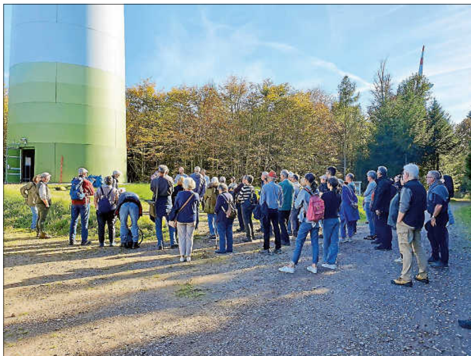
Die Fahrt der Dialoggruppe führte zum Windpark Langenhard bei Lahr.

Die Ettlinger Dialoggruppe Windenergie beriet in ihrer 3. Sitzung am 8. Oktober über die Frage, ob Windenergie im Wald vertretbar ist und wenn ja, unter welchen Bedingungen. Gemeinsam mit weiteren interessierten Bürgerinnen und Bürgern besuchte die Gruppe dann am 25. Oktober den Windpark Langenhard bei Lahr im Schwarzwald.