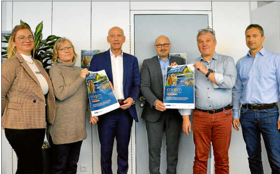
Bei der Präsentation der Plakate für die enkom – die Energiemesse von Stadtwerke und Stadt.

Aussteller in der Schlossgartenhalle/Vorträge im Schloss