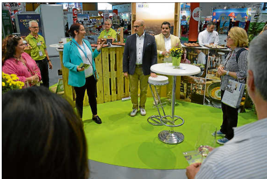
Gemeinsam am Stand von Albtal Plus die Gemeinden aus dem Albtal.

Nach der erfolgreichen Premiere im vergangenen Jahr, war klar, dass sich alle Mitgliedsgemeinden der Tourismusgemeinschaft Albtal Plus – Bad Herrenal, Dobel, Ettlingen, Karlsbad, Malsch, Marxzell, Straubenhardt, Waldbronn – wieder zusammen an einem Stand auf der Offerta präsentieren.