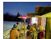
Winterfeier FVE-Tennis 2024