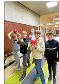
Kegeln mit der Tennisjugend