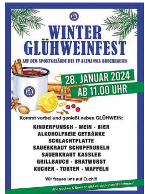
Plakat: FVA Bruchhausen

Die 1. und 2. Mannschaft trainiert an diesem Morgen, man kann also auch da etwas zuschauen.