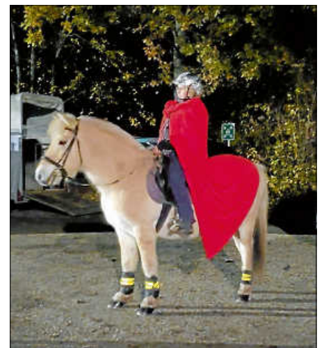
St. Martinsreiter in Oberweier

Zeitlich ist St. Martin von kurzer Dauer. Aber viele helfende Hände tragen zum Gelingen bei.