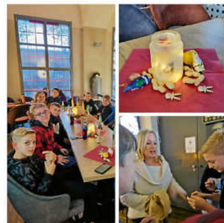
Martinsfeier in der Kulisse

Unser Fazit: es war ein tolles Event – tolle Kids, toller Film, tolles Essen!