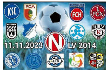
Plakat: P. Kochanek

der kleine FVA aus Bruchhausen. Doch trotz der langen Anreise und den scheinbar übermächtigen Gegnern ließen sich die Kinder kein bisschen beirren und boten von Anfang an einen Fußball, der sich in diesem Turnier nicht verstecken musste. In einer schwierigen Gruppe mit dem Karlsruher SC, dem FC Augsburg, dem 1. FC Heidenheim und drei starken Amateurklubs aus Reutlingen, Wendelstein und Waiblingen spielten sie jedes Spiel mindestens auf Augenhöhe. Nach zwei Kantersiegen gegen den Bundesligisten aus Heidenheim und die Spieler des FSV Waiblingen und einigen engen Schlammschlachten auf dem berüchtigten Feld 3 des Veranstalters 1. FC Normannia Gmünd standen sechs Punkte und ein mehr als respektable Platz 5 in der Vorrunde. Ein Ende fand dieser erinnerungswürdige Tag im Spiel um Platz 9 gegen die Young Boys aus Reutlingen, einem wahrhaftigen Thriller, in dem das alles entscheidende Tor zum 1:0-Sieg für ein rundes Ende und Feierlaune bei den zurecht stolzen Bruchhausenern sorgte.