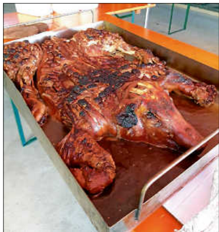
Unser leckeres Spanferkel