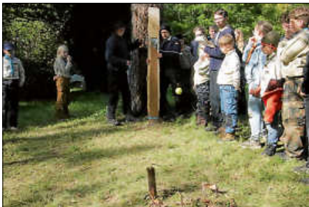
Ob der Ball wohl trifft?