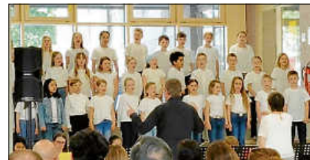
Einweihung Neubau

Ein großes Dankeschön geht an alle Akteure, die diesen Nachmittag und das Fest so erfolgreich gemacht haben.