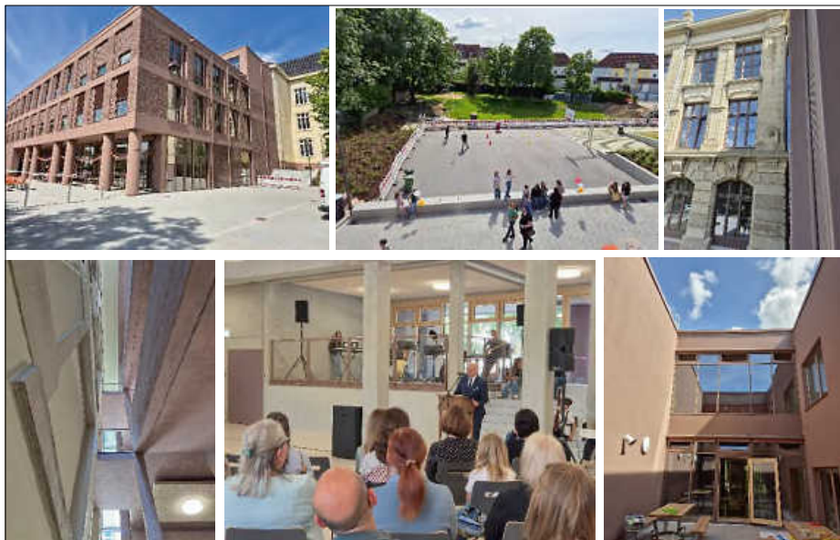
Eindrücke von der neuen alten Schillerschule, die dieses Jahr ihren 120. Geburtstag feiert.