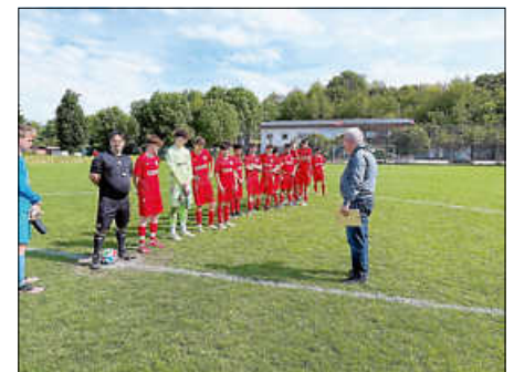
B-Jugend wird Rückrundenstaffelmeister