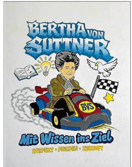
Wandgemälde von Schülern

Und das Projekt ist noch nicht abgeschlossen: In weiteren Bereichen der Schule warten neue Flächen darauf, gestaltet zu werden. So wird die Schule weiter Stück für Stück bunter – und bleibt ein Ort, an dem Kreativität, Engagement und Gemeinschaft großgeschrieben werden. Aus dem transkribierten Radiobeitrag des SWR