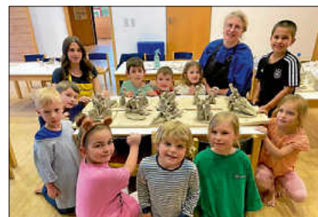
Die Künstlerin, ihre Assistentin, die Schulanfänger und ihre Werke