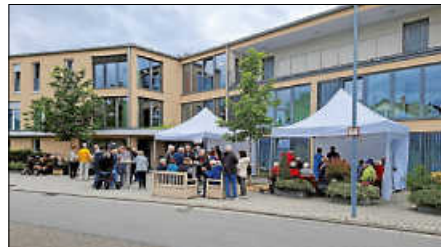
Reger Besuch des Erdbeerfestes

Das Erdbeerfest vor dem Seniorenhaus in Bruchhausen war wieder ein voller Erfolg. So viele Besucher wie dieses Mal hat es noch nie gegeben. Das lag wohl zum Teil auch daran, dass die regelmäßigen Teilnehmer am Bürgertreff, der ausfallen musste, statt zum Vereinsheim des KTZV zum Seniorenhaus gekommen sind. Die Erdbeerbowlie ging weg, ebenso wie die alkoholfreie Variante. Und auch den dazu gereichten Törtchen wurde eifrig zugesprochen. Das Wetter war auch ganz manierlich, so dass die Zelte eigentlich nicht gebraucht wurden.