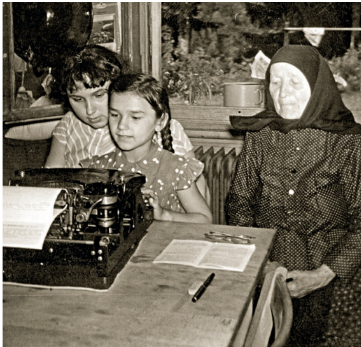
Foto: Aussiedlerinnen im Lager Lerchenberg in Karlsruhe-Durlach