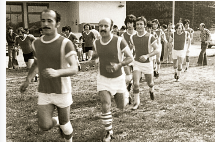
Foto: Türkische Fußballmannschaft 1979 (Türkischer Arbeitnehmerverein)

Ettlingen hat große Zuwanderungsbewegungen erlebt, die Stadt hat sich dabei völlig verändert. Die „Geschichten vom Ankommen“ machen bewusst, dass Zuwanderung seit 1945 ein fortdauernder Prozess ist.