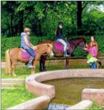
„Sandsteinbrunnen No. 23“ lt. Ettlenger Brunnenkataster“ alias „AGADIRs whirl-pool“: beliebter markanter Treff für Wasserspaß & Meditation ...