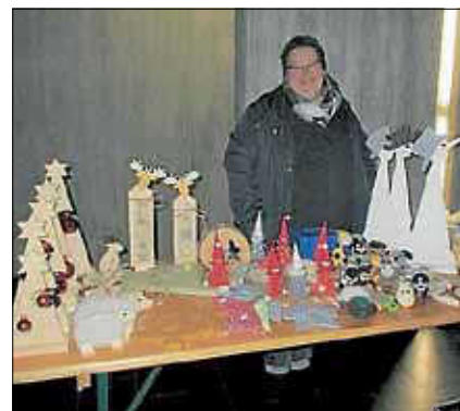
Hier ist für jeden etwas dabei

Am 15. Dezember bietet sich gleich 2-fach die Möglichkeit noch kurzfristig ein schönes mit viel Liebe selbstgefertigtes Weihnachtsgeschenk zu finden. Zum einen am Vormittag nach dem Gottesdienst, zum anderen am Nachmittag im Rahmen des Kirchenkonzertes des Musikvereins Frohsinn um 18 Uhr.