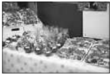
Plätzchenstand beim Adventsbasar

Was für ein gelungener Adventsbasar im Tierheim! Am Sonntag mussten wir morgens improvisieren: Heftiger Wind ließ die Zelte gefährlich schwanken und es war unmöglich, die Seitenwände anzubringen. Flohmarkt, Glühweinstand und die Waffelbäckerei mussten wegen Regen und Sturmböen spontan an anderer Stelle aufgebaut werden. Wir hatten Sorge, dass sich nur wenige Besucher einfinden würden. Aber sie kamen - und zwar in Strömen! Unser kleines Tierheim war brechend voll und wir freuen uns riesig über die jährliche Steigerung an tierlieben Besuchern. Der zum Großteil neu gewählte Vorstand konnte sich vorstellen und quasi den Einstand feiern. Alte und neue Gesichter wurden begrüßt, viele nette Gespräche geführt und es liefen Freudentränen, wenn vermittelte Schützlinge auf ihre alte Tierheimfamilie getroffen sind. Die Stimmung war ausgelassen und fröhlich – ein rundum gelungenes Fest.