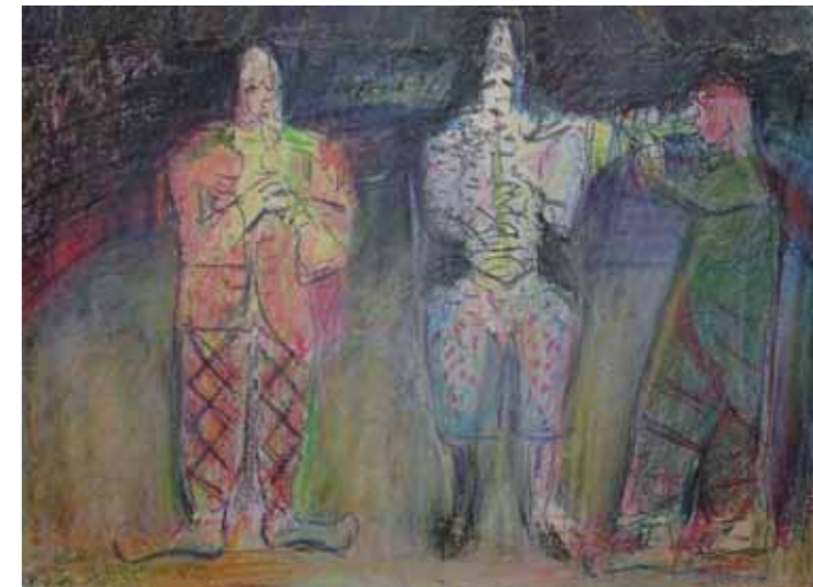
Hanfried Streit (1914–1999) Aus der Serie: Zirkus, 1985, Pastellkreide auf Papier